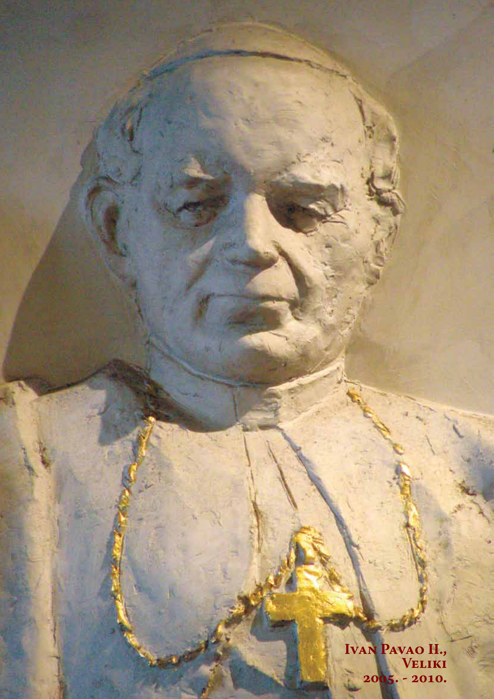
IVAN PAVAO II., VELIKI 2005. - 2010.