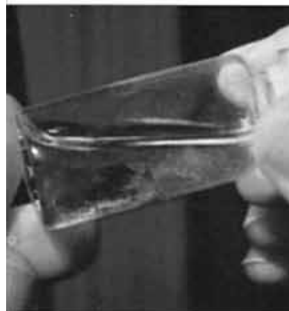
čuvana argentyńska Hostia