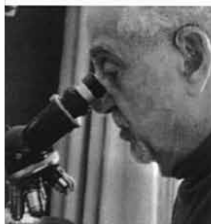
Zugibe ogleda pod mikroskopem argentyńską Hostię misioną w cało