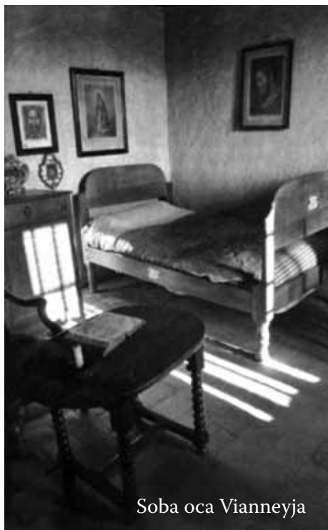
Soba oca Vianneyja

Najveće duhovne vrijednosti, napredak u duhovnom životu, postižu se svakodnevnim unutarnjim borbama s kušnjama, slabostima i grijesima. Župnik arški cijelim je svojim srcem želio osvojiti nebo i pomoći svim župljanima da se spase. Zato je na nakanu njihova obraćenja, ne samo mislio, već i strogo postio, bičevao se i vršio pokoru. Bio je potpuno svjestan da je najveća čovjekova nesreća grieh i ustrajnost u grijehu, jer je njegova konačna posljedica odjeljenje od Boga do vijeka i vječnost u paklu. Zato je s velikom gorljivošću raskrinkavao đavolsko djelovanje koje u svakoj kušnji, na neobično zavodljiv način predstavlja grijeh kao izvor sreće.